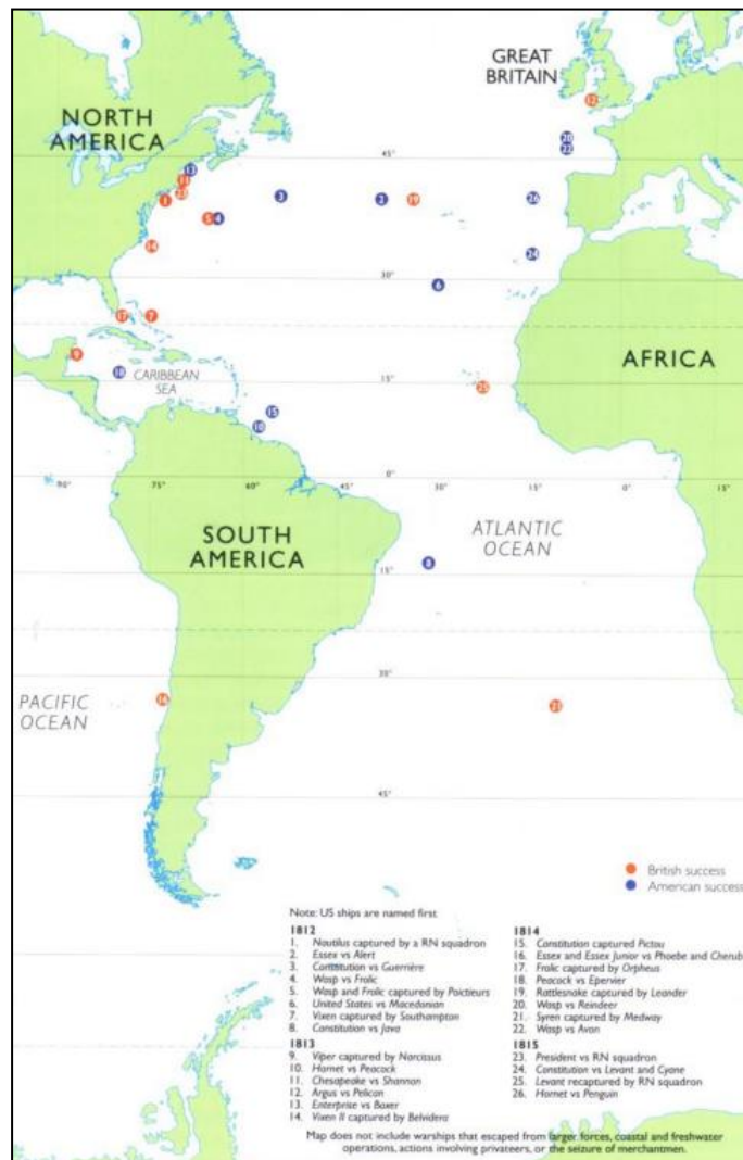
FIGURA 3 LA GUERRA EN EL MAR ENTRE LA US NAVY Y LA ROYAL NAVY ENTRE 1812 Y 1815