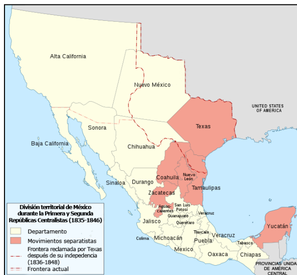
FIGURA 4 MAPA DE LOS MOVIMIENTOS SEPARATISTAS EN MÉXICO DONDE APARECE TEXAS

La guerra terminó de forma dramática para México. Tras la Batalla de San Jacinto del 21 de abril de 1836, el General Santa Anna fue capturado y obligado a firmar los Tratados de Velasco del 14 de mayo de 1836, donde reconocía la independencia de Texas, se comprometía al cese de las hostilidades y se establecía la frontera en el Río Grande. Sin embargo, el gobierno mexicano no reconoció el tratado por haber sido firmado por un prisionero que no tenía la facultad legal para hacerlo, motivo por el cual hubo varias incursiones mexicanas en Texas en los años siguientes, las que siempre fueron repelidas, aunque los texanos nunca pudieron mantener su pretendida frontera. 36 (Fig. 4).