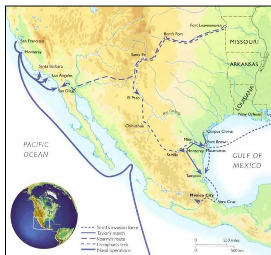
FIGURA 6 MAPA DE LAS OPERACIONES MILITARES DE ESTADOS UNIDOS EN MÉXICO 1846-1848