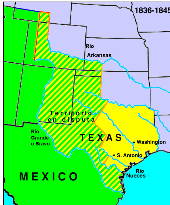
FIGURA 5 MAPA DE LA DISPUTA ENTRE TEXAS Y MÉXICO