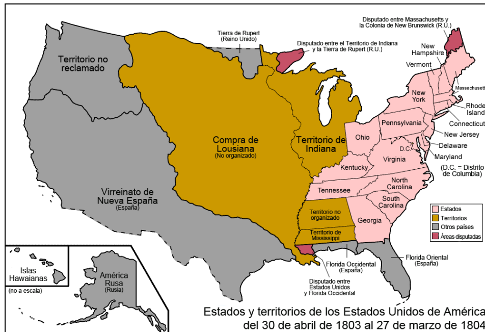
FIGURA 2 MAPA DE LA EVOLUCIÓN TERRITORIAL DE LOS ESTADOS UNIDOS HASTA 1803

su propia Madre Patria: Gran Bretaña, que perseguía por aquella época el mismo objetivo: ser una potencia marítima comercial y militar, y para ello necesariamente debía controlar todos los océanos. En el caso del Pacífico, eso sí, le salió competencia de sus antiguas colonias y fueron éstas mismas las que le rebasaron en poder económico y productivo.