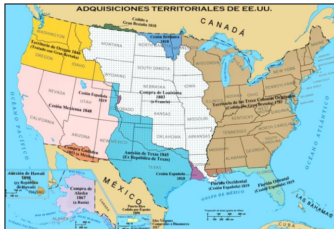
FIGURA 10 MAPA DE LAS ADQUISICIONES TERRITORIALES DE LOS ESTADOS UNIDOS

La idea de este trabajo era que el lector vislumbrara por medio de los datos entregados cómo Estados Unidos fue consiguiendo su “destino manifiesto” y cómo este desarrollo fue requerido por los europeos en 1817 y lo transformó en la primera potencia a nivel mundial. (Fig. 10)